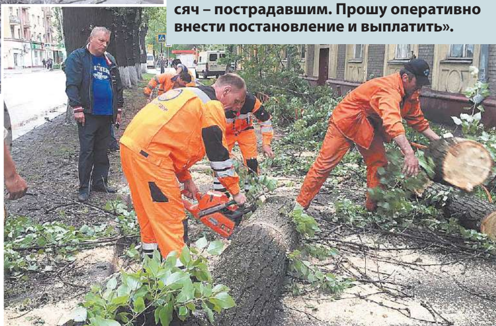
Аварийная бригада устраняет последствия урагана на ул. Циолковского

«По одному миллиону выплаты семьям погибших будут осуществлены, 500 ты- сяч – пострадавшим. Прошу оперативно внести постановление и выплатить».