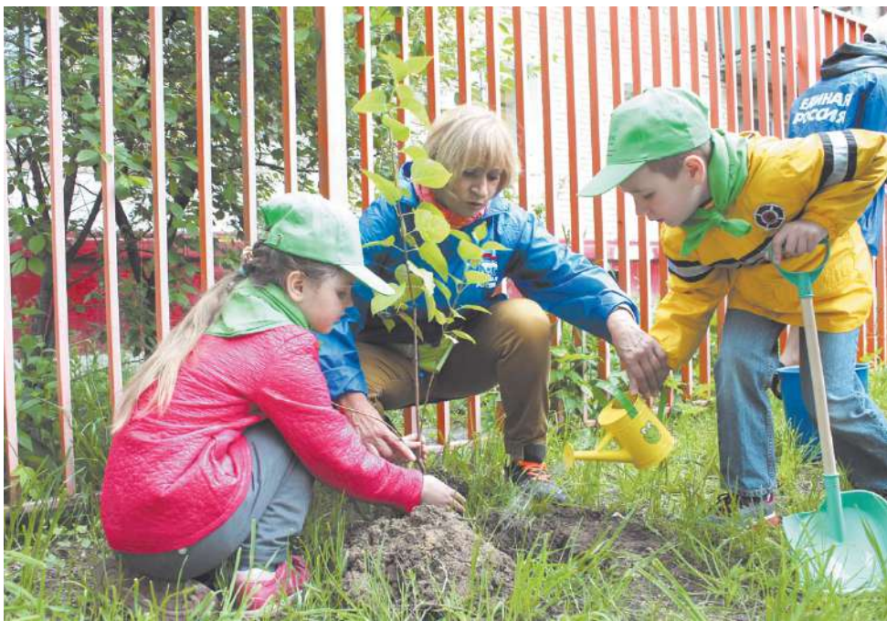
Дошколята увлечённо участвовали в акции