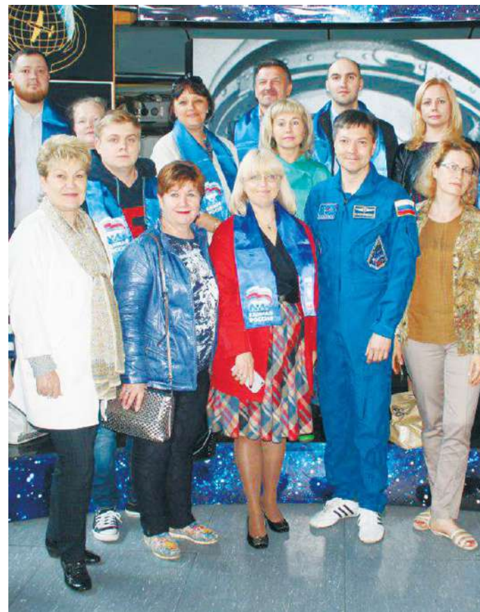
Королёвцы в Звёздном городке