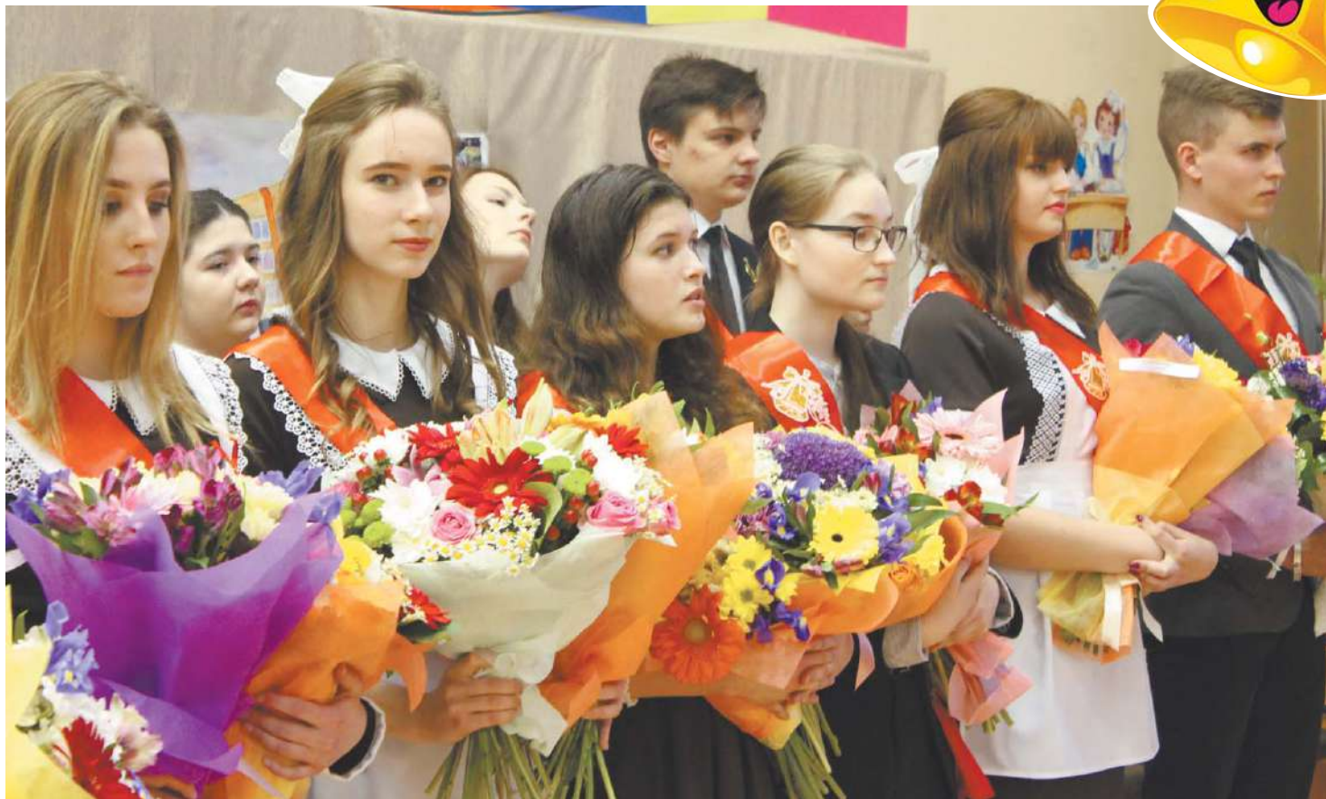
Выпускники гимназии № 18 на празднике Последнего звонка: и грустно, и радостно...

«В этот день вы сможете почувствовать себя частью единого и любимого всеми нами Подмосковья!» – прозвучало в обращении губернатора к тем, кто уже завтра составит славу нашего региона.