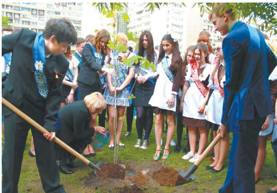
Каштан как символ памяти о выпускниках гимназии № 18

– У каждого из вас отличные стартовые позиции, ведь вы оканчиваете школу в Подмосковье – душе России, – напомнила ребятам Марина Захарова, министр образования Московской области, обращение которой было зачитано на празднике.