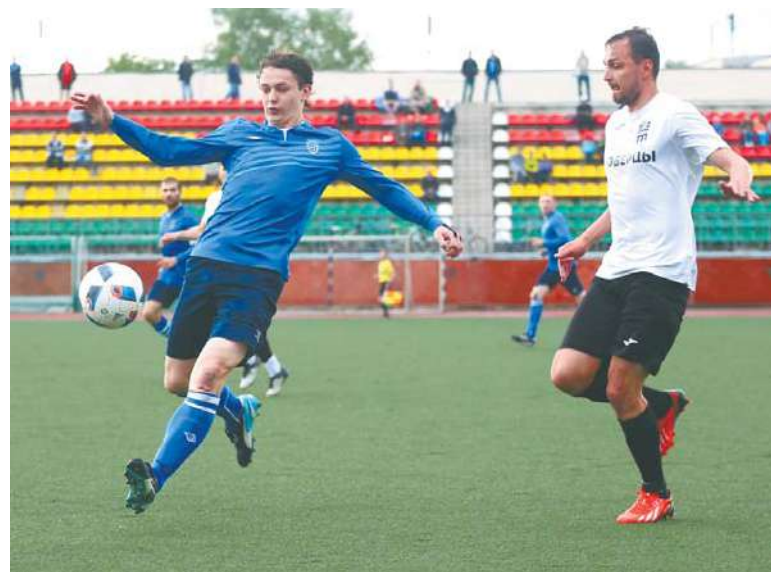
Идёт ожесточённая борьба за мяч...

После забитого мяча пошла совсем другая игра. «Люберцы» бросились отыгрываться и насе-