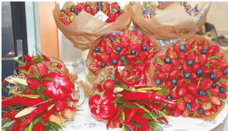
Ягодно-овощные букеты от «Алиры»